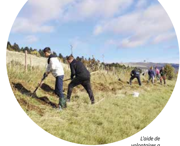
L'aide de volontaires a de nouveau été précieuse en 2023, notamment lors de la plantation de haies, comme ici à Lordel.

Une vingtaine de mairaines et parrains du paysage se sont retrouvés à la mi-juin à Cortébert lors d'une journée de formation autour de la photographie architecturale pour une sensibilisation au projet que le Parc entend mener autour des cœurs de villages dans les 12 communes du Parc inscrites à l'ISOS. Cet inventaire fédéral des sites construits d'importance nationale à protéger en Suisse est géré par l'Office fédéral de la culture. En Suisse, 1200 sites construits sont répertoriés.