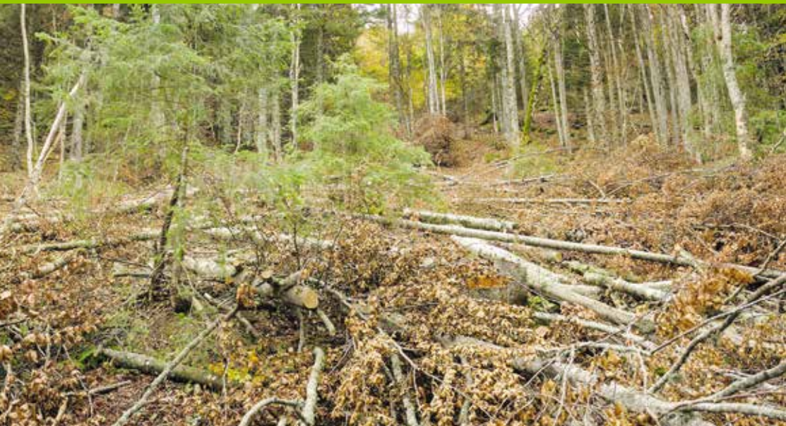
Des travaux en faveur de la nature sont réalisés dans les réserves forestières partielles depuis 2005, en collaboration avec les propriétaires et l'Office des forêts du canton de Berne.