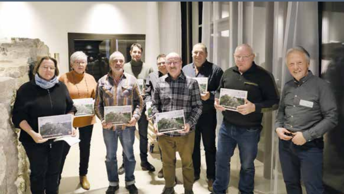
Dès 2025, le Parc comptera 31 communes membres (23 aujourd'hui). Les 8 nouvelles communes ont été dignement accueillies lors d'une AG extraordinaire.

UNE ORGANISATION EFFICACE INTÉGRÉE À LA RÉGION