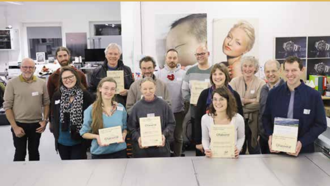
Un certificat imprimé sur bois est remis aux entreprises partenaires du Parc.