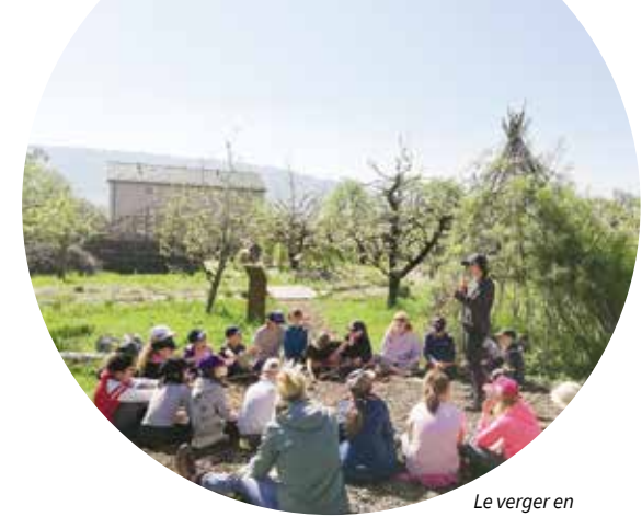
Le verger en permaculture séduit les écoles, mais aussi les adultes: 9 groupes (161 personnes) ont profité d'une visite guidée en 2023.

Le partenariat avec Evologia, testé dès 2022, s'est intensifié pour permettre à ce site situé au cœur du Val-de-Ruz de devenir un centre important pour l'éducation à la durabilité et l'accueil de groupes. Une collaboratrice scientifique a été engagée conjointement par Evologia et le Parc. Son rôle: développer les offres existantes et nouvelles pour les classes d'écoles, les familles et les entreprises, et amplifier leur promotion. En 2023, l'animation pédagogique « Permaculture et petites herbes » a été étendue aux classes enfantines. En 2023, 15 classes l'ont suivie. Onze autres ont participé aux ateliers potagers, et 29 classes ont parcouru les jeux de pistes en autonomie, soit un total de 55 classes et 994 élèves.