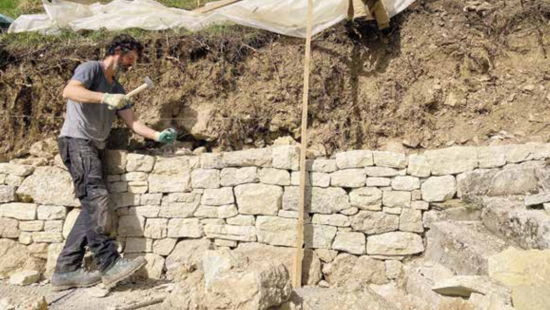
La réfection des murs du vignoble du lac de Biemme contribue à la protection contre l'érosion et est profitable aux lézards, abeilles sauvages et autres papillons.

UN PATRIMOINE VALORISÉ, DES PAYSAGES VIVANTS