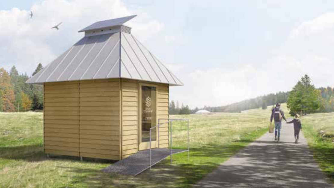
Le projet «Les Arches» a été retenu par le concours d'architecture «Cabanons» pour constituer un point de vente de produits régionaux.