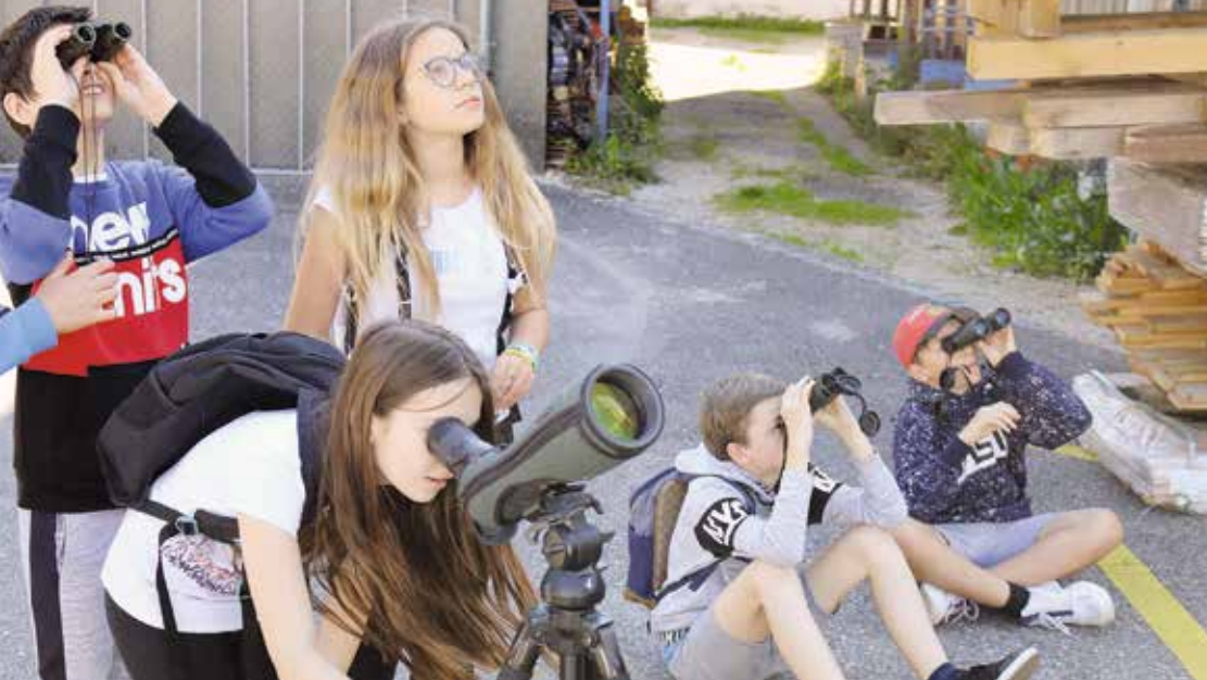
Des élèves effectuent des recensements d'hirondelles dans leur village, lesquels sont transmis à la Station ornithologique suisse.