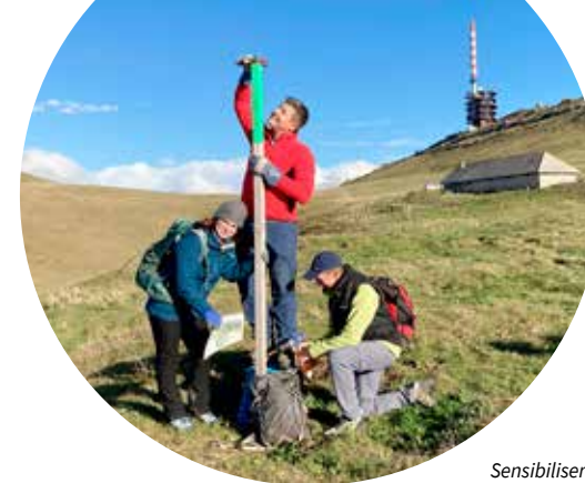
Sensibiliser et canaliser les déplacements constituent des missions dévolues aux parcs naturels régionaux.

Le suivi de l'alouette lulu et du pipit des arbres sur 2 sites importants du Parc s'est poursuivi en 2023 en collaboration avec la Station ornithologique suisse. Avec 33 territoires sur les 4,2 km 2 recensés, l'alouette lulu a atteint un nouveau record (5 territoires en 2006). Dans ces mêmes secteurs, seuls 51 territoires de pipit ont été découverts, un record... négatif pour cet autre oiseau typique des pâturages boisés diversifiés.