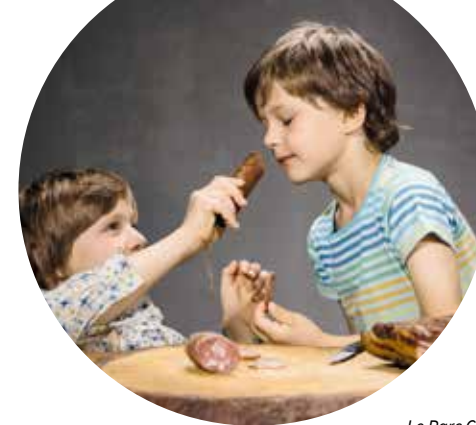
Le Parc Chasseral compte désormais 225 produits labélisés « Parcs suisses ». Nombre d'entre eux sont vendus à La Couronne, à Sonceboz.

L'assortiment de produits labélisés du Parc Chasseral s'étoffe. Cinq nouveaux partenaires ont labélisé des produits en 2023 : le Moulin Le Torrent, le Domaine Shalomhof, Christophe Chocolatier, la boulangerie Donzé et la boucherie Pellet. Vingt-sept producteurs-trices sont aujourd'hui associées au Parc Chasseral avec 225 produits au total. Une augmentation rendue possible notamment grâce aux efforts du Parc pour diversifier l'offre de produits du terroir proposés dans la Boutique de La Couronne, à Sonceboz. L'assortiment de cette dernière se compose de produits arborant au minimum le label Grand Chasseral regio-garantie.