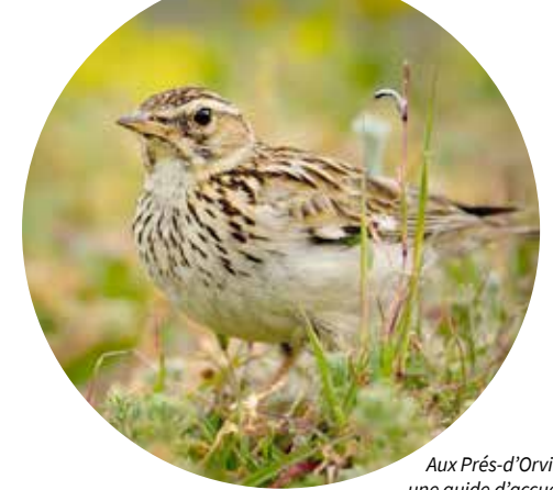
Aux Prés-d'Orvin, une guide d'accueil sensibilise les visiteurs et visiteuses au respect de la nature et au travail agricole, notamment avec une carte postale dotée de conseils et illustrée par cette alouette lulu.

Les Parcs Chasseral, du Diemtigtal et de Gantrisch ont fait l'objet d'un sondage de terrain mené par l'Université de Berne. But : mieux comprendre les comportements de loisirs des visiteurs en hiver, en lien avec la protection de la faune. 95% des personnes interrogées considèrent celle-ci comme importante ou très importante. Le non-respect des règles en vigueur serait dû à des informations insuffisantes sur le terrain.