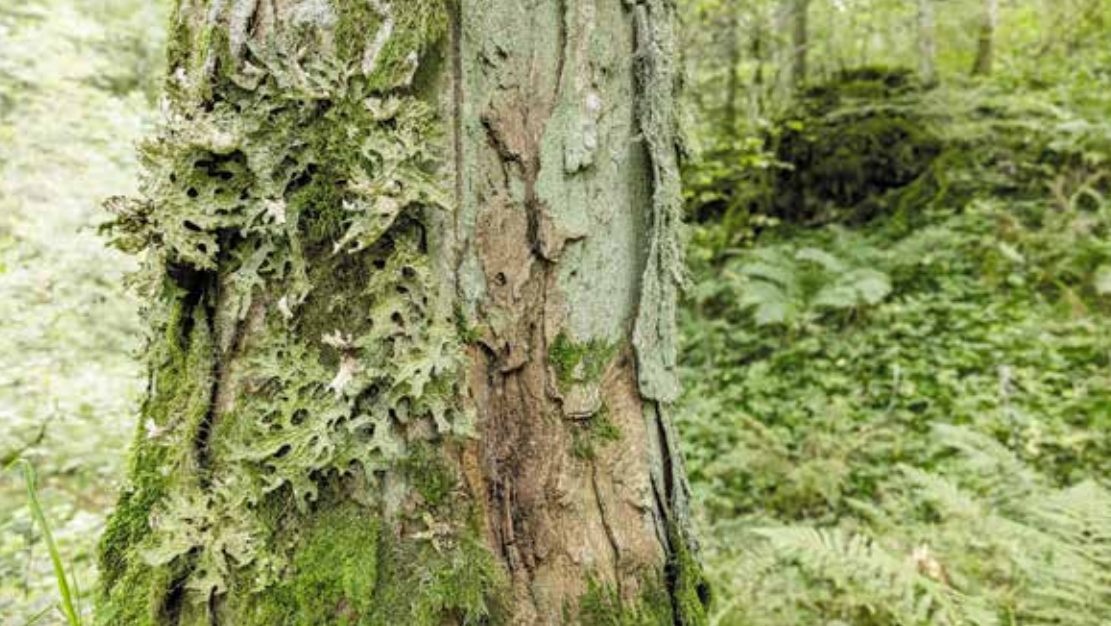
Les presque 8000 arbres-habitats relevés depuis 2018 constituent une source de données intéressante pour la recherche.

UNE RECHERCHE POUR DES ACTIONS BIEN CIBLÉES