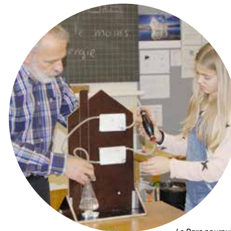
Le Parc poursuivra et affinera encore son travail avec les écoles dans le cadre du projet Région Energie.

La transition énergétique est sur toutes les lèvres et les conditions-cadres se mettent en place. En 2023, le Parc s'est associé à l'association des communes Jura bernois. Biemme, Espace découverte Energie et la coopérative Ecoosol pour obtenir un soutien dans le cadre du dispositif Région Energie. Le Parc participe au comité de pilotage de ce projet qui comprend 3 volets: panneaux photovoltaïques sur les bâtiments des communes, diagnostic du potentiel de production d'énergie et de chaleur à partir de la biomasse, renforcement de la sensibilisation à l'énergie dans les écoles. Le Parc accompagne la mise en œuvre de ce dernier volet. La thématique de l'énergie est importante pour le Parc, qui a déjà développé plusieurs projets ces dernières années (projet Interreg Peace Alps, groupe énergie, extinctions nocturnes, etc.).